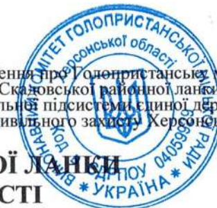
СХЕМА ГОЛОПРИСТАНСЬКОЇ СУБЛАНКИ СКАДОВСЬКОЇ РАЙОННОЇ ЛАНКИ ТЕРИТОРІАЛЬНОЇ ПІДСИСТЕМИ ЄДС ЦЗ ХЕРСОНСЬКОЇ ОБЛАСТІ

Додаток 1 до Положення про Голопристанську міську субланку Складовської районної ланки територіальної підсистеми єдиної державної системи цивільного захисту Херсонської області